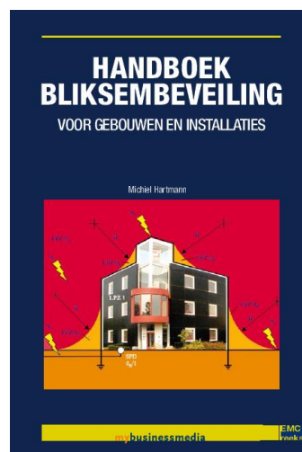
Handboek Bliksembeveiliging 3 e druk, geschreven door Michiel Hartmann

Een gebouw is 10 meter hoog en voorzien van een normaal dak; de afstand tussen de leidingen van de bliksemafleiderinstallatie en de metalen in het gebouw zijn minimaal 1 meter. Via berekening kan nu worden bepaald dat een installatie met mazen van 20 x 20 m, zonder spanningsvereffening, een beveiligingsvermogen oplevert van circa 74%. Indien in pandige metalen delen worden vereffend loopt dat op naar 84%. Wordt er echter een installatie met mazen van 10 x 10 m aangebracht, dan zal het beveiligingsvermogen zonder vereffening circa 89% bedragen, met vereffening circa 95%.